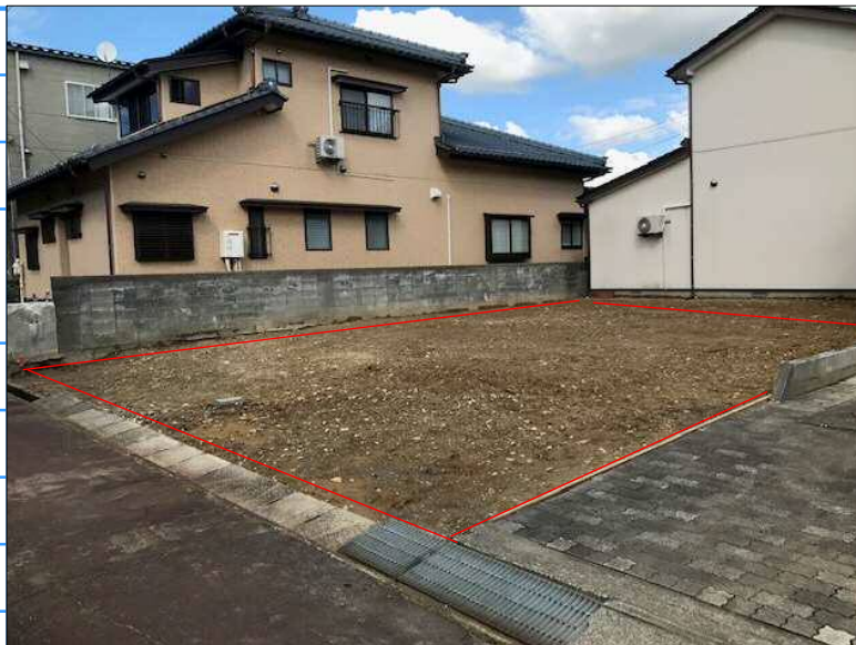
三条機械製作所跡 (予想・地理院地図参照)